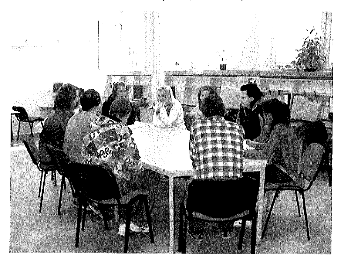
obr. 10 Cvičná firma, odbor škola podnikania, SOŠT Zvolen