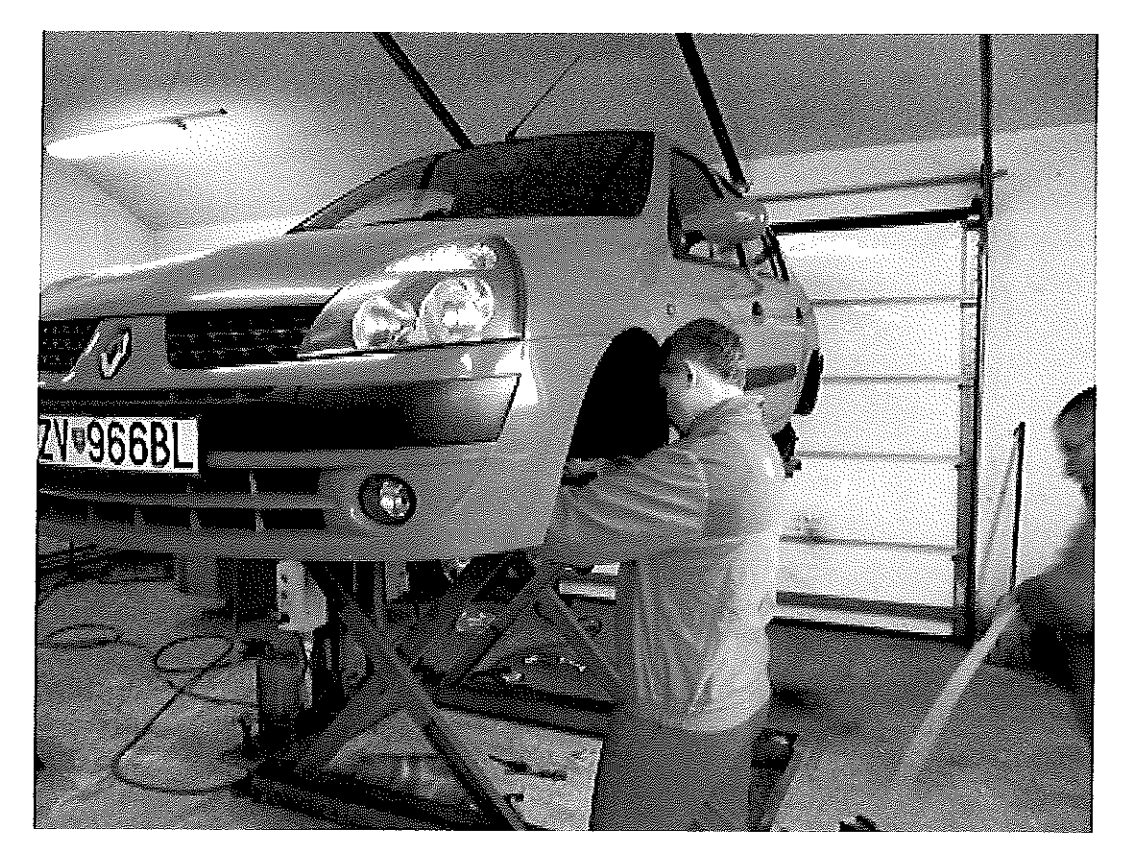
obr. 7 Práca na odbornom výcviku, autoopravár - mechanik, SOŠT Zvolen