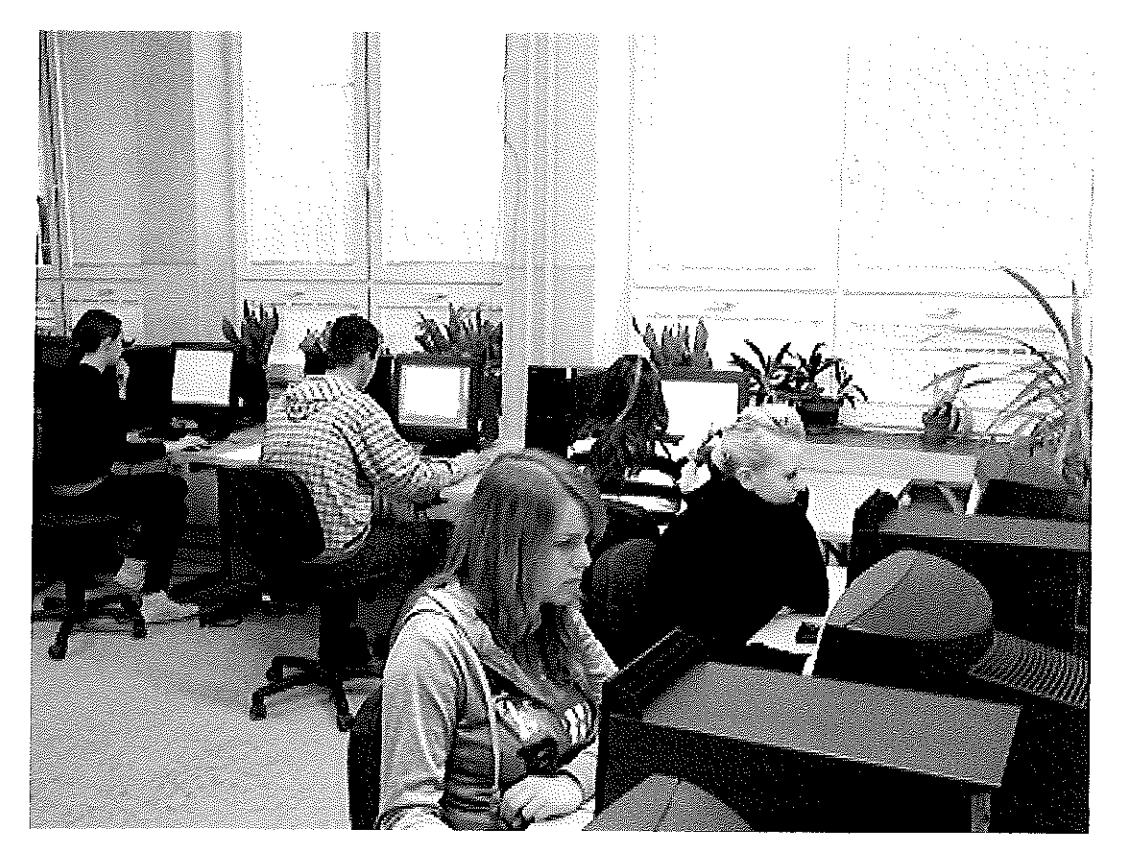
obr. 9 Práca na odbornom výcviku, odbor KPD, SOŠT Zvolen