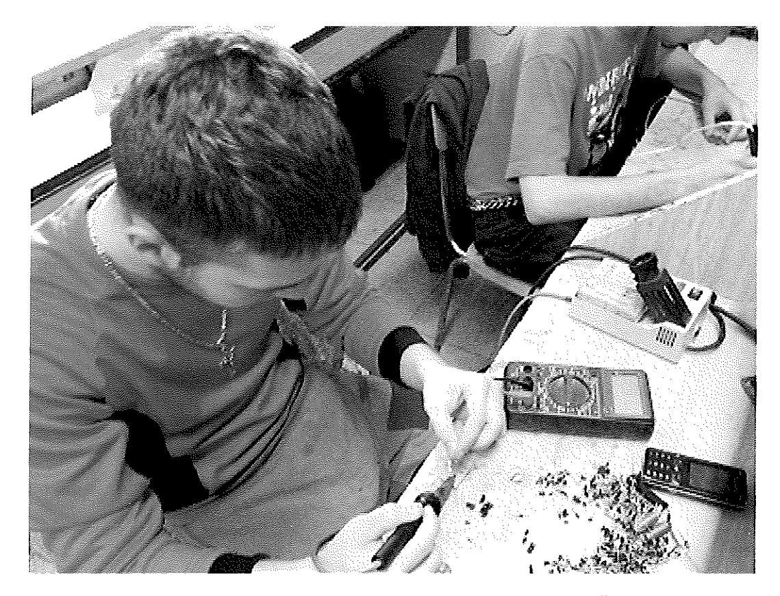
obr. 6 Práca na odbornom výcviku, elektro odbor, SOŠT Zvolen