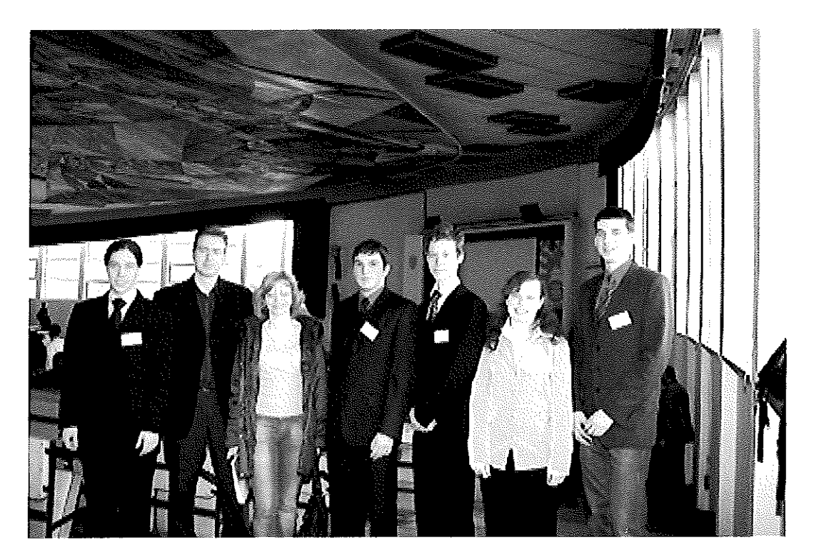
obr. 2 Strojárska olympiáda, TU Bratislava