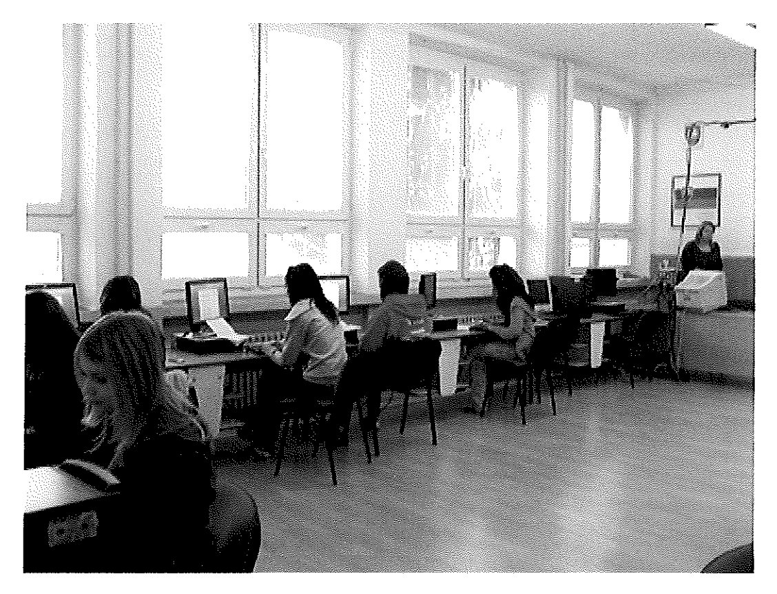
obr. 5 Súťaž v písaní na PC, SOŠT Zvolen