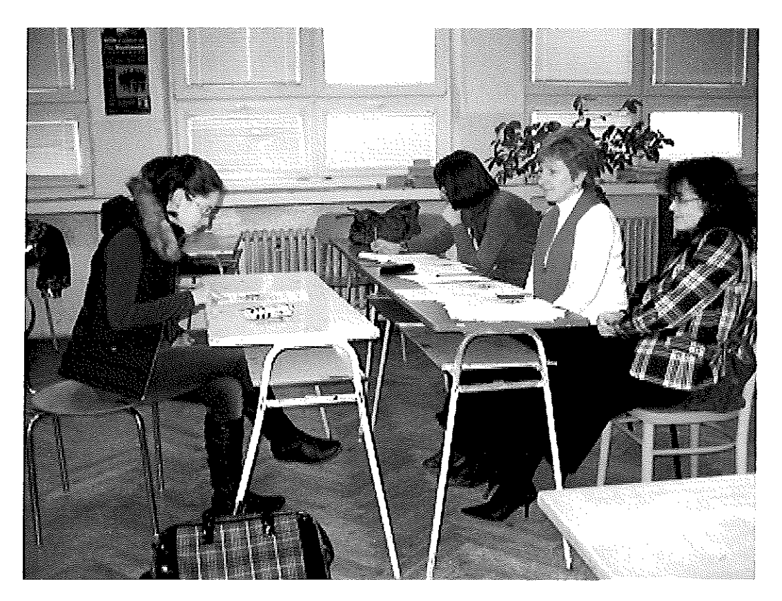
obr. 4 Olympiáda v nemeckom jazyku, SOŠT Zvolen