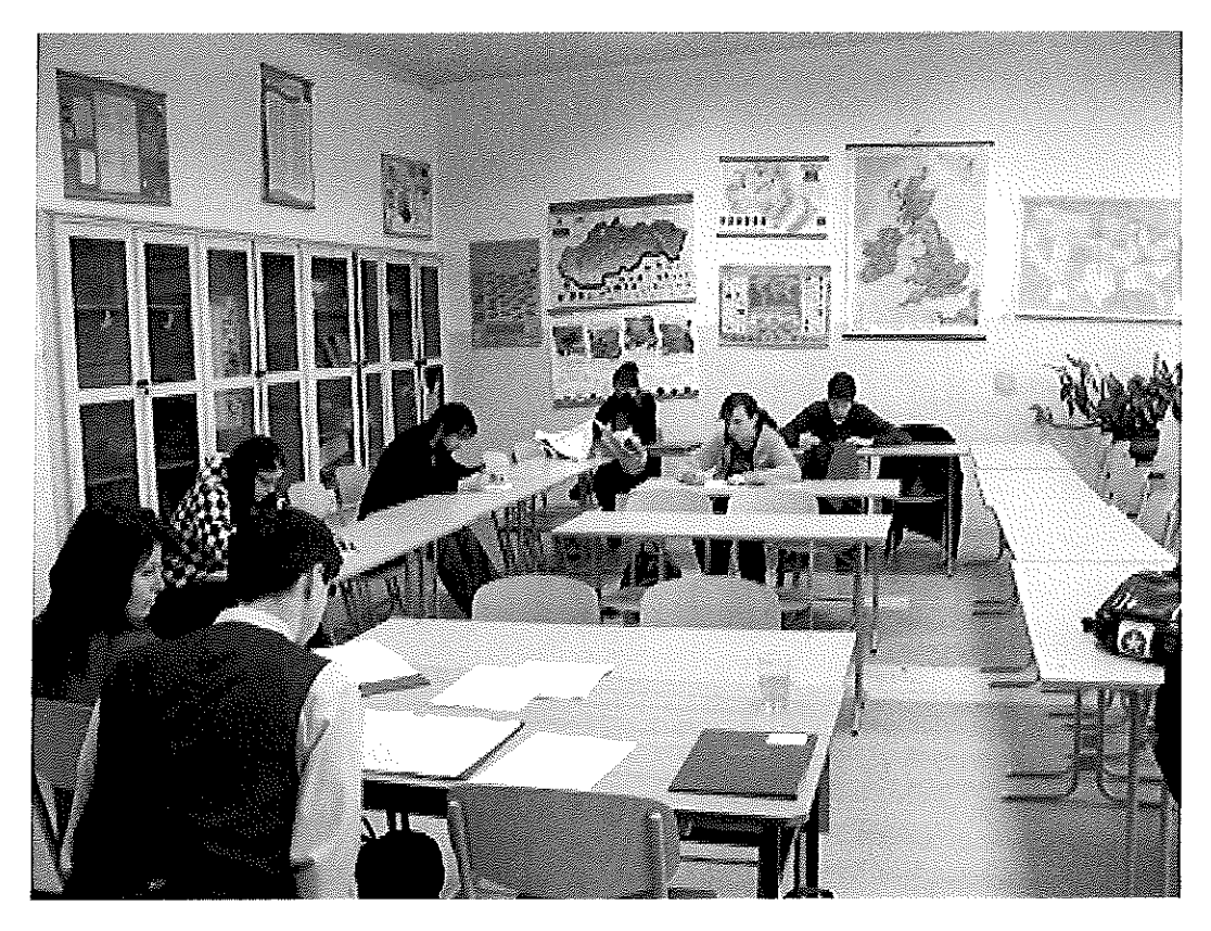
obr. 1 Olympiáda v anglickom jazyku, SOŠT Zvolen