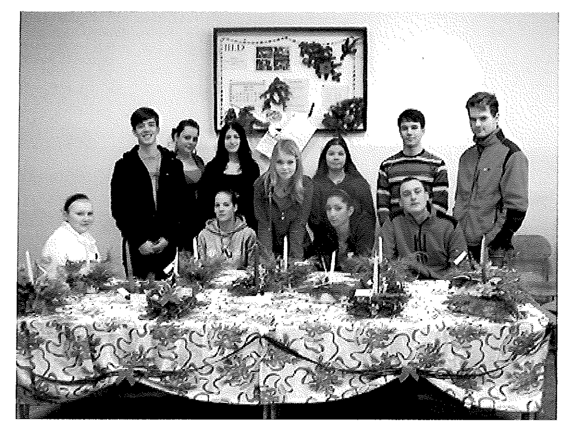
obr. 3 Vianočná akcia študentskej spoločnosti Hviezda, SOŠT Zvolen