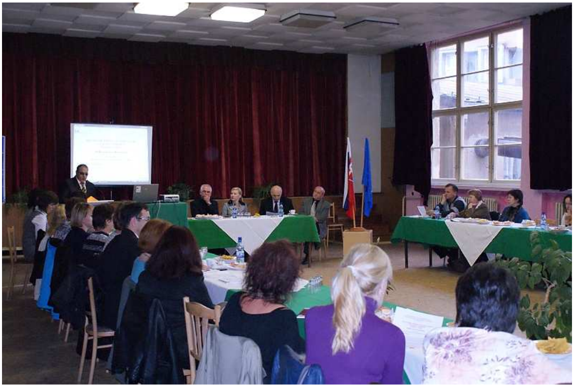
obr. 3 Konferencia cvičných firiem, SOŠT Zvolen