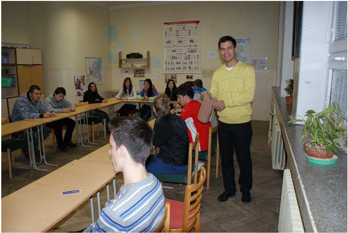
obr. 7 Olympiáda v nemeckom jazyku, SOŠT Zvolen