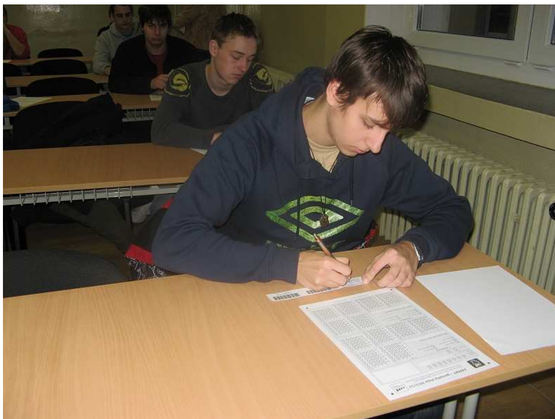
obr. 10 Vedomostná súťaž „Expert“, SOŠT Zvolen