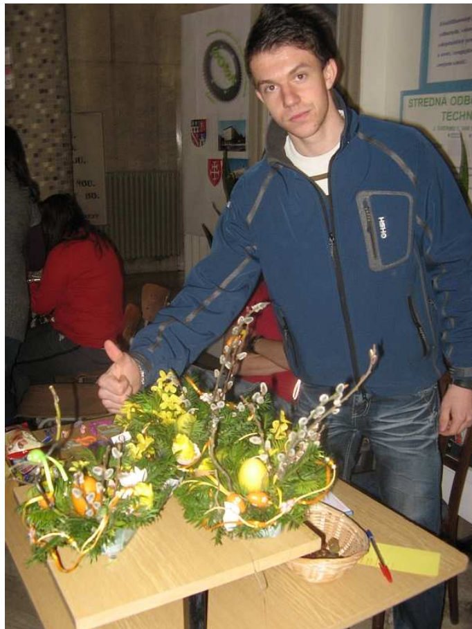
obr. 8 Predajná akcia cvičnej firmy, SOŠT Zvolen