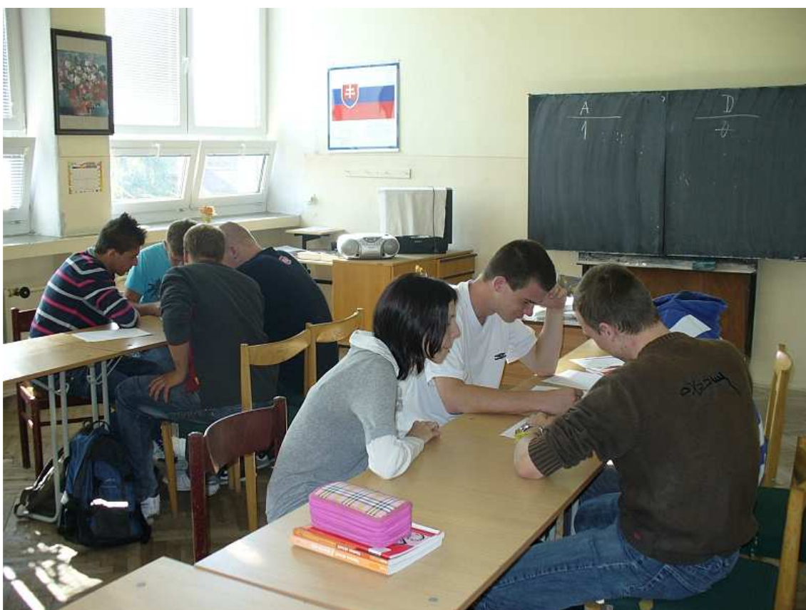
obr. 2 Európsky deň jazykov, SOŠT Zvolen