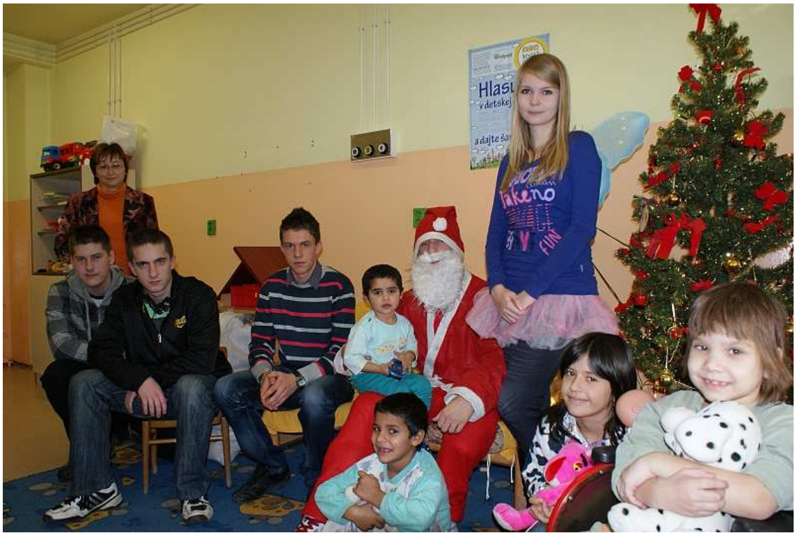
obr. 5 Charitatívna akcia v detskej nemocnici, Zvolen