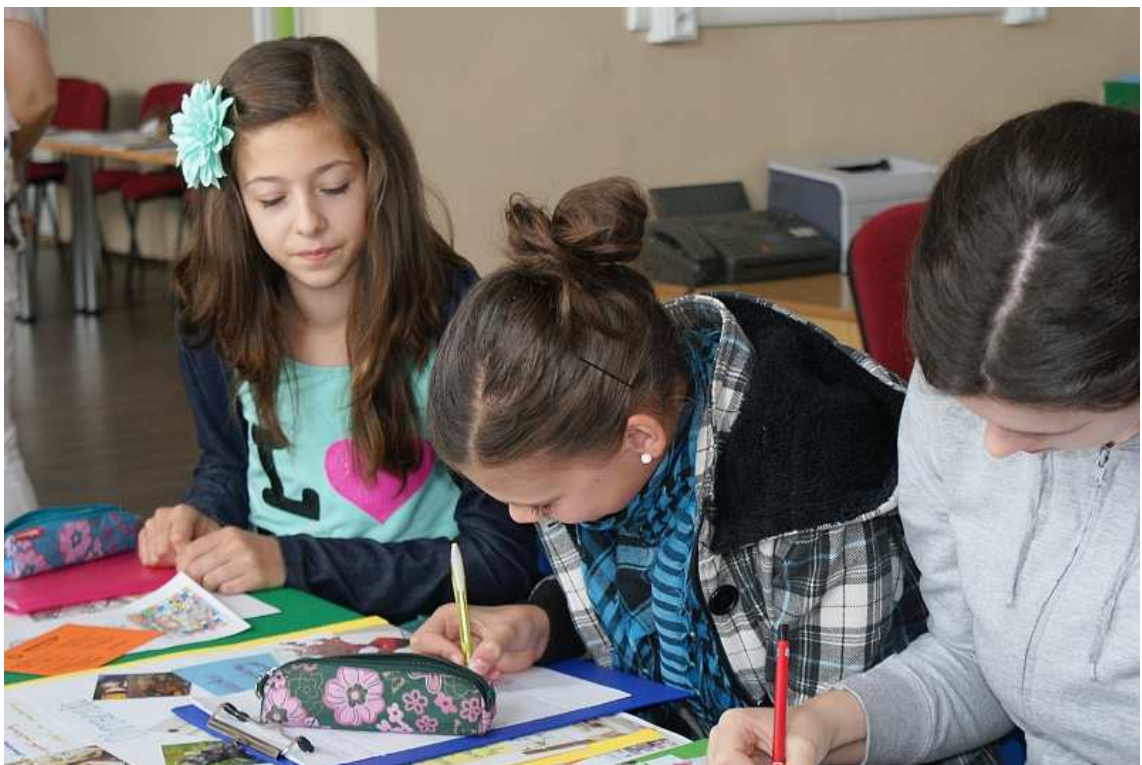
obr. 6 Súťaž pre žiakov ZŠ „Mladý finančník“, SOŠT Zvolen