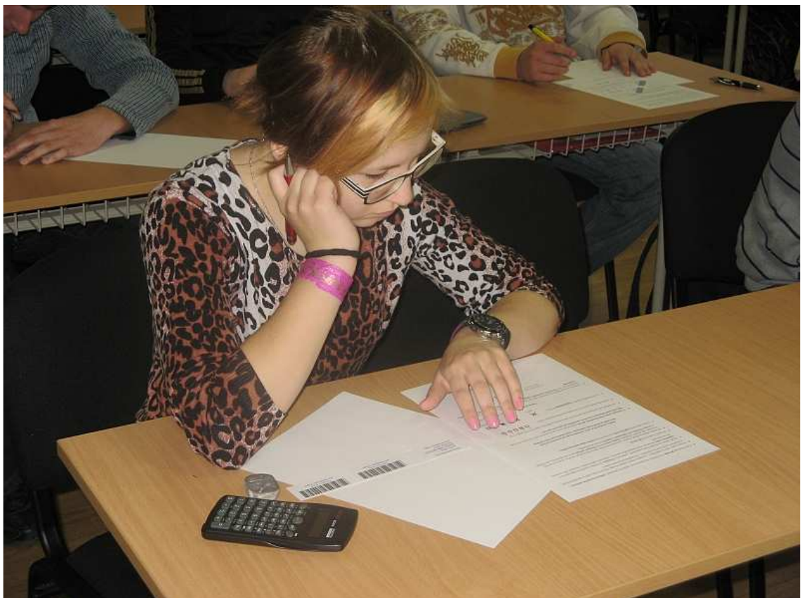
obr. 4 Súťaž „Matematický klokan“, SOŠT Zvolen