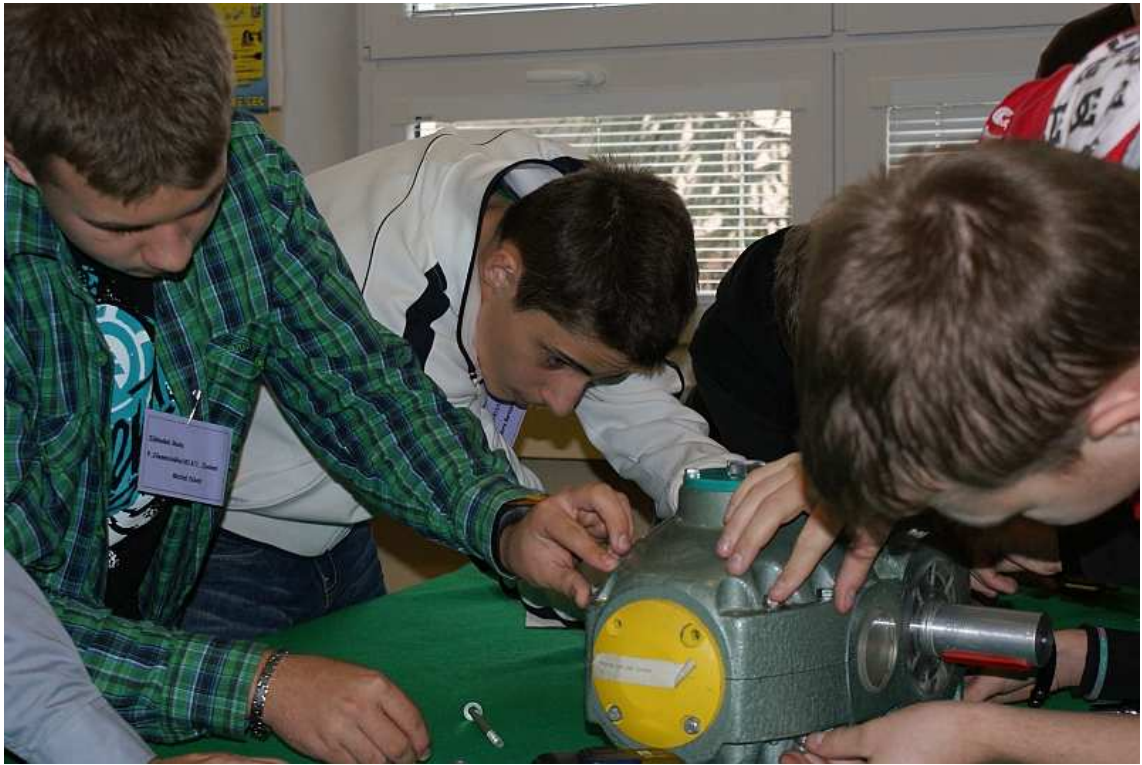
obr. 11 Súťaž pre žiakov ZŠ „Technický talent“, SOŠT Zvolen