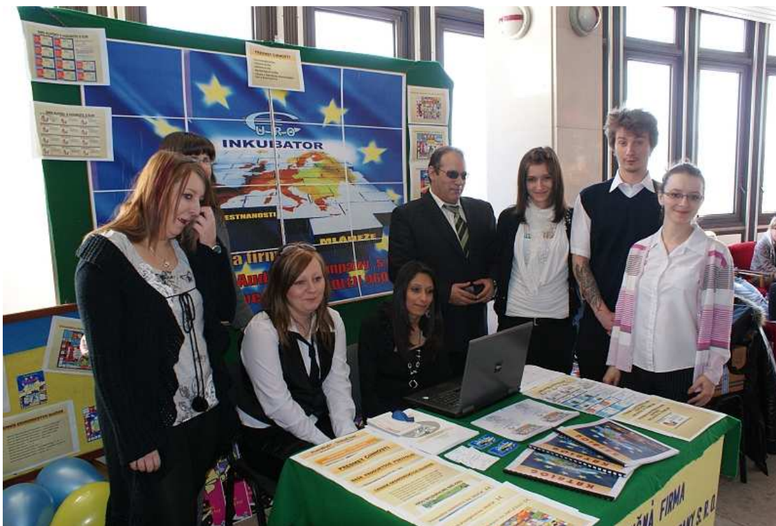
obr. 1 Burza cvičných firiem, Žiar nad Hronom